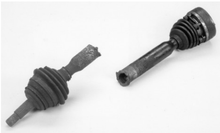
Nem lehet törött