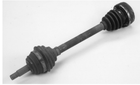
Teljesnek kell lennie és nem túl korrodáltnak