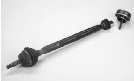
Teljesnek kell lennie mindkét gömbfejnek