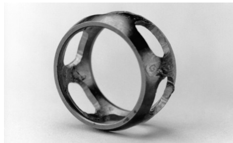
Nem lehet sérült magas hőmérséklet által