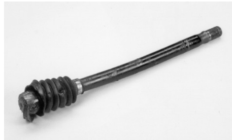
Teljesnek kell lennie a gömbfejnek