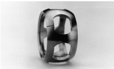
Nem lehet sérült