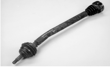
Teljesnek kell lennie és nem görbének